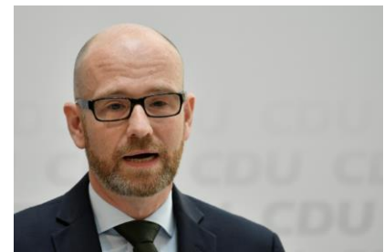
CDU-Generalsekretär Peter Tauber

Tauber antwortete umgehend: „Wenn Sie was Ordentliches gelernt haben, dann brauchen Sie keine drei Minijobs.“ Minijobber fassten dies als Diffamierung auf.