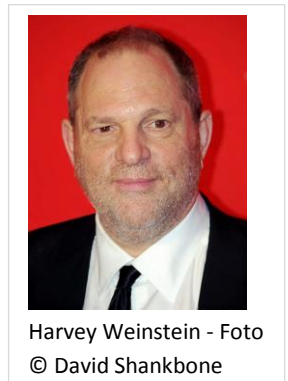
Harvey Weinstein

1979 gründeten die Brüder das Unternehmen Miramax. Es wurde 1993 an Disney verkauft. Filme, die von Miramax und den Weinsteins produziert sind, sind unter anderen Scary Movie und Der englische Patient . 2005 gründeten Harvey und Robert Weinstein die Weinstein Company in New York. In der Trilogie Herr der Ringe und vielen anderen Filmen war Weinstein geschäftsführender Produzent.